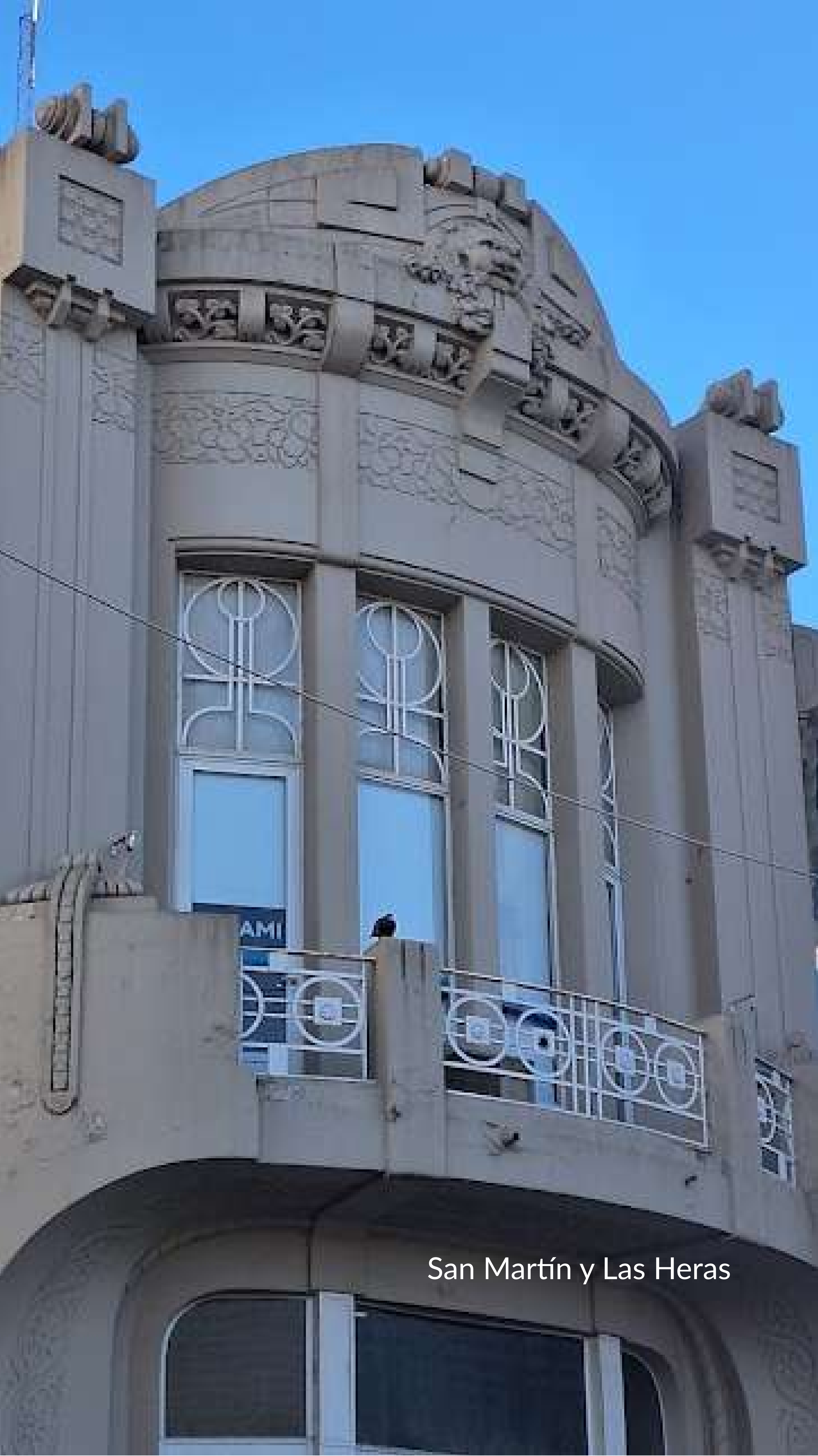
San Martín y Las Heras