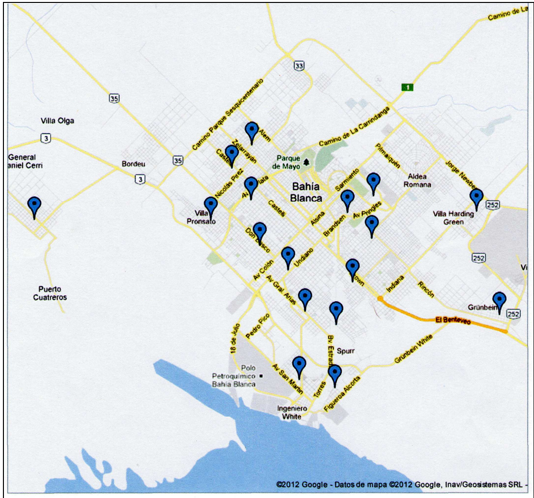
Mapa 1: Distribución geográfica de los consultorios odontológicos dependientes de la Secretaría de Salud de la Municipalidad de Bahía Blanca.